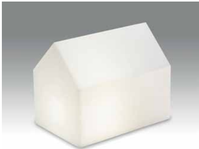
TALO, Mirja Orvola/Studio Orvola