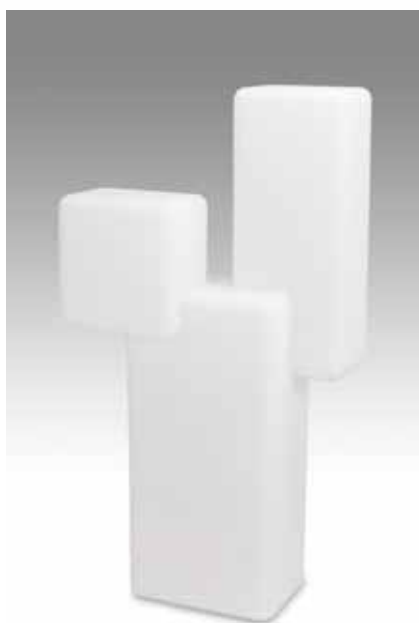
KUBO MAXI, Eero Aarnio