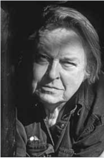
Eero Aarnio (s. 1932) sisustusarkkitehti, professori h.c.

Eero Aarnio on yksi suurista modernin kalustemuotoilun vaikuttajista Suomessa ja maailmalla. Tunnetuksi hän tuli 1960-luvulla lasikuidusta muotoilemistaan Pallo - ja Pastilli -tuoleista, joiden valmistus on jatkunut vuosikymmeniä, aina tähän päivään asti. Hänen muotoilijan uransa on jatkunut menestyksekkäästi jo yli 45 vuotta. Tyypillistä Aarnion muotoilulle ovat leikkisät, pelkistetyt muodot ja raikkaat värit. Lisäksi hän tavoittelee suunnittelussaan taloudellisesti kestäviä ratkaisuja sekä esineen käyttäjän että sen valmistuksen kannalta. Viime vuosina Aarnion luova tuotteliaisuus on vain lisääntynyt ja uusia trendikkäitä sisustustavaroita, huonekaluja, valaisimia ja tekstiilejä syntyy useita vuodessa. Hän on saanut useita merkittäviä palkintoja mm. International Design Award of the A.I.D., New York 1968, Pastilli-tuolista, Suomi-palkinto 2005, Compasso d'Oro- eli Kultainen harppi -palkinto Magisille suunnittelemastaan Trioli-tuolista, Italia 2008. Aarnion töitä on pysyvässä näyttelyssä mm. New Yorkin Museum of Modern Artissa, Lontoon Victoria and Albert Museumissa ja Weil am Rheinin Vitra Design Museumissa.